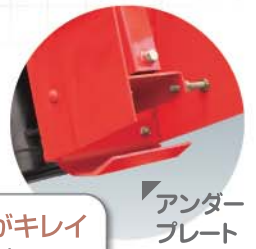
アンダープレート