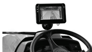
『KAG2,KSRU(トラクタ側別売り)』